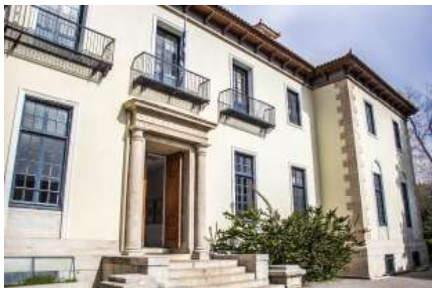
Είσοδος Κεντρικού Κτηρίου επί της Λεωφ. Βενιζέλου

Το αποτέλεσμα, όπως αποτυπώνεται στην πολυσέλιδη έκθεση της επιτροπής, ήταν άριστο για το Χαροκόπειο Πανεπιστήμιο, αφού έλαβε τη μεγαλύτερη δυνατή αξιολόγηση (fully compliant). Η Πιστοποίηση του Ιδρύματος αποδεικνύει ότι το Χαροκόπειο Πανεπιστήμιο διαθέτει Πολιτική Ποιότητας κατάλληλη για την επίτευξη των στρατηγικών του στόχων με διαφανείς διαδικασίες σε όλα τα επίπεδα σπουδών (προπτυχιακό, μεταπτυχιακό, διδακτορικό και μεταδιδακτορική έρευνα).