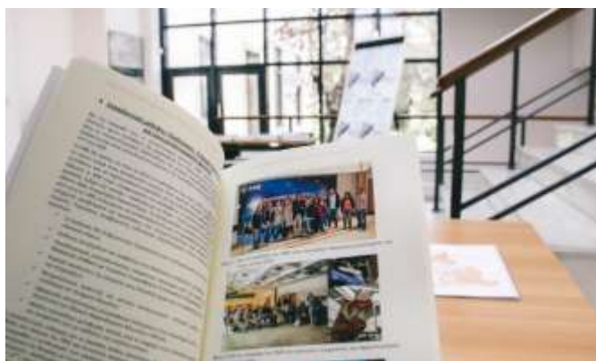
2016: Επετειακή Εκδήλωση για τα 10 χρόνια λειτουργίας του ΠΜΣ.