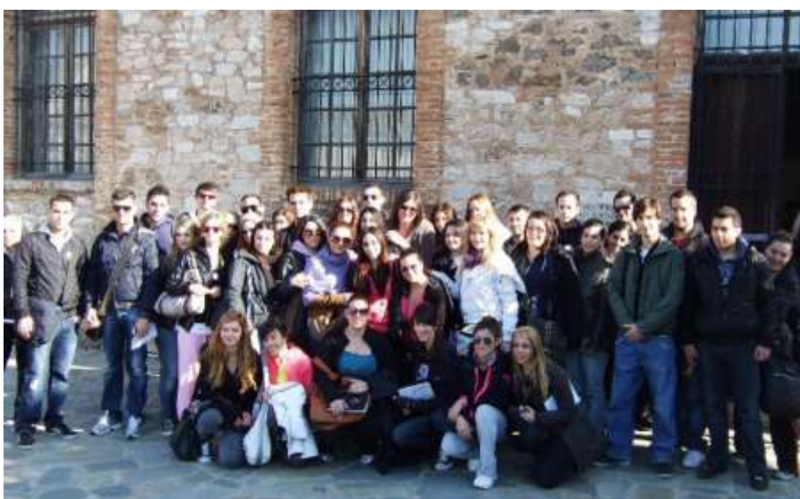
2011: Εκδρομή στη Λαυρεωτική (3 ο έτος)

Εκδρομές και επισκέψεις πραγματοποιούνται στα περισσότερα από τα εξάμηνα, είναι υποχρεωτικές και διαφοροποιούνται σε διάρκεια και περιεχόμενο ανάλογα με τις ανάγκες των μαθημάτων.