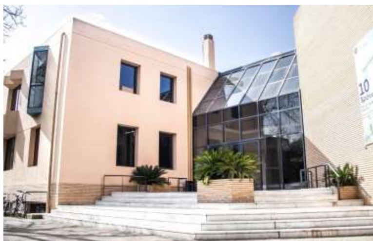
Το κτίριο του Τμήματος Γεωγραφίας

γεωγράφου. Αναλυτικά οι εν δυνάμει χώροι επαγγελματικής και επιστημονικής δράσης και συνεισφοράς των πτυχιούχων γεωγράφων στους επί μέρους τομείς της οικονομίας και της κοινωνίας είναι: Κρατικός και ευρύτερος Δημόσιος τομέας, Οργανισμοί Τοπικής και Περιφερειακής Αυτοδιοίκησης, επιχειρήσεις με εθνικό-περιφερειακό δίκτυο, σύνδεσμοι ή σύμβουλοι επιχειρήσεων, εταιρείες και γραφεία μελετών, Μέση Εκπαίδευση (διορισμός τους μέσω της κατηγορίας ΠΕ04.05 κατόπιν εξετάσεων), Επιστημονική Έρευνα και Μη Κυβερνητικές Οργανώσεις.