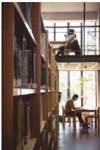
Η βιβλιοθήκη του Χαροκοπέιου Πανεπιστημίου

Η εκπόνηση πτυχιακής εργασίας δεν είναι υποχρεωτική. Οι φοιτητές που το επιθυμούν μπορούν να την αντικαταστήσουν με τέσσερα (4) επιπλέον μαθήματα επιλογής από το 7ο και 8ο εξάμηνο.