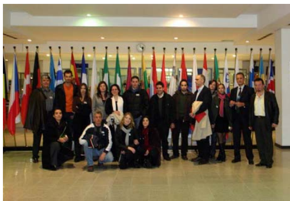
Φωτο 9: Από την εκδρομή του ΠΜΣ στις Βρυξέλλες το 2006

The Postgraduate Programme awards the Postgraduate Diploma of Specialization in the fields of knowledge of the three Courses as outlined above. The official bodies for the organization and operation of the Postgraduate Programme are the General Assembly of the Department of Geography, the Coordinating Committee and the Director of Postgraduate Studies.