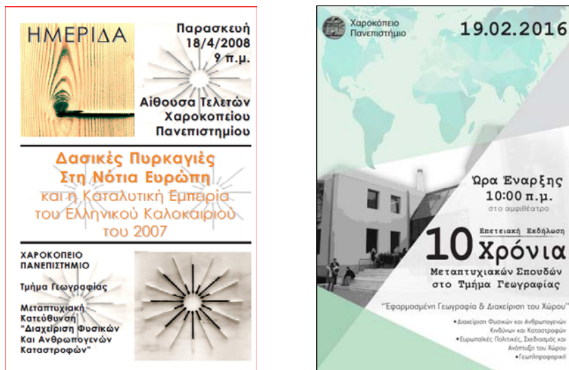
Σχήμα 2: Αφίσες ημερίδας που πραγματοποιήθηκε στο Τμήμα την άνοιξη του 2008 και της επετειακής εκδήλωσης για τα 10 χρόνια λειτουργίας του ΠΜΣ που πραγματοποιήθηκε στο Τμήμα τον Φεβρουάριο του 2016