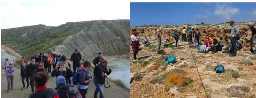
Φωτο 2: Από την επίσκεψη του ΠΜΣ στη Μάλτα (2017)