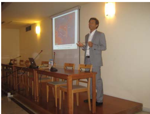
Φωτο 6: Κατά τη διάρκεια διάλεξης από τον καθηγητή Mauro Soldati το 2013, Professor, Dipartimento di Scienze Chimiche e Geologiche, UNIMORE - Università degli studi di Modena e Reggio Emilia