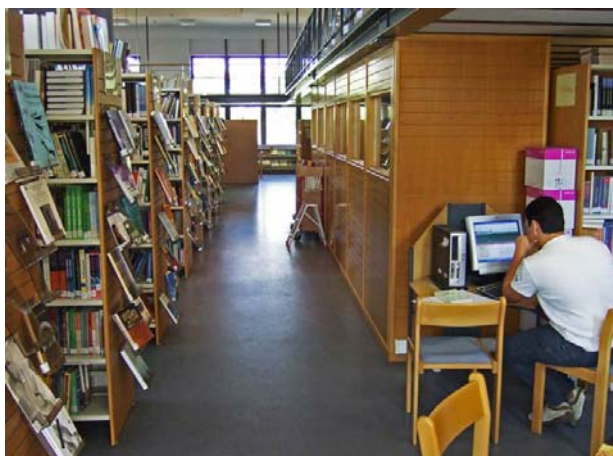
Φωτο 8: Η βιβλιοθήκη και το αναγνωστήριο του Χαροκοπέιου Πανεπιστημίου

Οι ΜΦ του τμήματος έχουν πλήρη πρόσβαση στη Βιβλιοθήκη του Χαροκόπειου Πανεπιστημίου (φωτο 8) η οποία λειτουργεί στο κτήριο του Τμήματος Γεωγραφίας (Επίπεδο 4). Η συλλογή της Βιβλιοθήκης περιλαμβάνει αρκετά μεγάλο αριθμό εντύπων (βιβλία, περιοδικά, κ.λπ.) και άλλο εκπαιδευτικό υλικό σε ψηφιακή μορφή. Το μεγαλύτερο μέρος του υλικού που σχετίζεται με το αντικείμενο του Τμήματος Γεωγραφίας είναι στην ελληνική και την αγγλική γλώσσα, ενώ υπάρχει υλικό και σε άλλες γλώσσες. Καταβάλλεται προσπάθεια έτσι ώστε το υλικό που σχετίζεται με το αντικείμενο του ΠΜΣ να εμπλουτίζεται και να ανανεώνεται σε συνεχή βάση. Οι ΜΦ, εκτός από το δανεισμό των βιβλίων μπορούν επίσης να μελετούν το υλικό της Βιβλιοθήκης στο Αναγνωστήριο που λειτουργεί στον ίδιο χώρο. Σημειώνεται ακόμη ότι εκτός από τα αντίτυπα των επιστημονικών περιοδικών, η Βιβλιοθήκη παρέχει πρόσβαση και σε μεγάλο αριθμό ηλεκτρονικών βιβλιοθηκών μέσω του Ελληνικού Δικτύου Ακαδημαϊκών Βιβλιοθηκών (HEAL-Link). Με αυτό τον τρόπο, οι ΜΦ μπορούν να αναζητήσουν και να διαβάσουν άρθρα από περιοδικά χωρίς να χρειαστεί να διαθέτουν το φυσικό υλικό. Μέσω της υπηρεσίας αυτής παρέχεται πρόσβαση σχεδόν σε όλες τις διεθνείς πηγές στο χώρο της Γεωγραφίας.