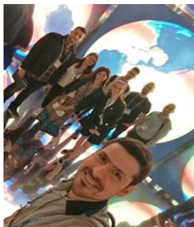
Φωτο 3 και 4: Από την επίσκεψη του ΠΜΣ σε Κων/πολη και Μιλάνο αντίστοιχα (Μάιος,2019)

Άλλες σημαντικές εκπαιδευτικές διαδικασίες/μέθοδοι που προωθούν την κινητικότητα και εξωστρέφεια των ΜΦ ή διαμορφώνουν ερευνητικές ευκαιρίες αλλά και ευκαιρίες για την ανάδειξη του έργου τους ήδη από το στάδιο των σπουδών τους είναι: