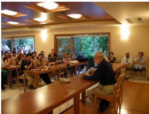
Φωτο 5: Κατά τη διάρκεια διάλεξης από τον καθηγητή David Harvey το 2012, Distinguished Professor, Dept. of Anthropology, City University of New York