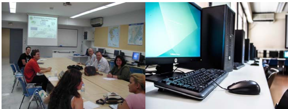
Φωτο 7: Το Εργαστήριο διαλέξεων και άλλων δραστηριοτήτων του ΠΜΣ

Οι εκπαιδευτικές και ερευνητικές δραστηριότητες του προγράμματος μεταπτυχιακών σπουδών καλύπτονται κυρίως από το Εργαστήριο 1.1 του μεταπτυχιακού (φωτο 7) το οποίο βρίσκεται στο Επίπεδο 1 του κτηρίου Γεωγραφίας και λειτουργεί με συνεχή υποστήριξη από εξειδικευμένο τεχνικό προσωπικό. Βασική αποστολή του εργαστηρίου αποτελεί η υποστήριξη των αναγκών των μεταπτυχιακών μαθημάτων και εργαστηρίων. Έτσι, οι ΜΦ εργάζονται σε ένα σύγχρονα εξοπλισμένο περιβάλλον με το απαραίτητο υλικό και λογισμικό. Το εργαστήριο αποτελείται από δώδεκα (12) θέσεις εργασίας με σύγχρονους προσωπικούς υπολογιστές. Η υποδομή του εργαστηρίου περιλαμβάνει επίσης εξυπηρετητή για τον διδάσκοντα και περιφερειακά εκτύπωσης (printers, plotter) καθώς και projector υψηλής ευκρίνειας. Το δίκτυο του εργαστηρίου συνδέεται με γραμμή Internet υψηλής ταχύτητας, ενώ παρέχονται επιπρόσθετα σταθερά και ασύρματα σημεία πρόσβασης ώστε να υπάρχει η δυνατότητα σύνδεσης μέσω φορητών υπολογιστών.