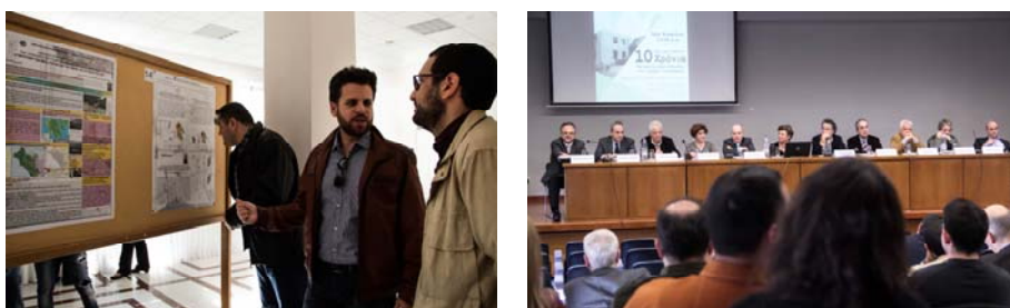
Φωτο 5: Από την επετειακή εκδήλωση για τα 10 χρόνια λειτουργίας του ΠΜΣ (Φεβρουάριος 2016)

της Ευρωπαϊκής και Διεθνούς Εταιρείας Περιφερειακής Επιστήμης (ERSA), «Αγροτική Οικονομία, Ύπαιθρος Χώρος, Περιφερειακή και Τοπική Ανάπτυξη» που έγινε στην Πάτρα στις 14-15 Ιουνίου 2013. Επιπλέον σημαντική ήταν η παρουσία ΜΦ με ανακοινώσεις στο Συνέδριο "Safe Evros 2016 - νέες τεχνολογίες και πολιτική προστασία" που διοργανώθηκε από το Δημοκρίτειο Πανεπιστήμιο Θράκης, και την Περιφέρεια Ανατολικής Μακεδονίας και