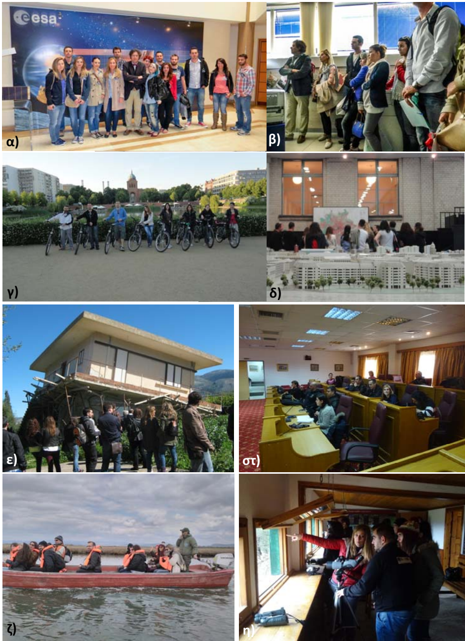
Φωτο 1: Από τις επισκέψεις του ΠΜΣ α) στον Ευρωπαϊκό Οργανισμό Διαστήματος στη Ρώμη (2013), β) στην Ιταλική Υπηρεσία Πολιτικής Προστασίας (2013), γ) και δ) στο Βερολίνο (2014), ε) στην Κεφαλονιά (2014), στ) στην Άρτα (2015), ζ) και η) στον Έβρο (2016)