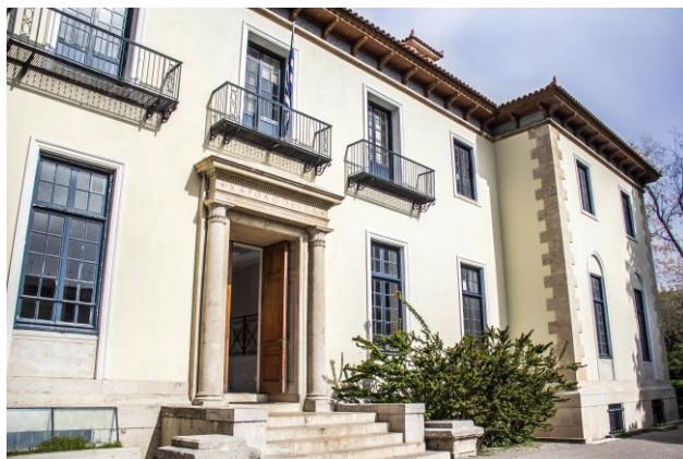
Είσοδος Κεντρικού Κτηρίου επί της Λεωφ. Βενιζέλου

Το αποτέλεσμα, όπως αποτυπώνεται στην πολυσέλιδη έκθεση της επιτροπής, ήταν άριστο για το Χαροκόπειο Πανεπιστήμιο, αφού έλαβε τη μεγαλύτερη δυνατή αξιολόγηση (fully compliant). Η Πιστοποίηση του Ιδρύματος αποδεικνύει ότι το Χαροκόπειο Πανεπιστήμιο διαθέτει Πολιτική Ποιότητας κατάλληλη για την επίτευξη των στρατηγικών του στόχων με διαφανείς διαδικασίες σε όλα τα επίπεδα σπουδών (προπτυχιακό, μεταπτυχιακό, διδακτορικό και μεταδιδακτορική έρευνα).