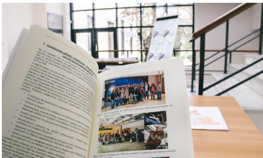
2016: Επετειακή Εκδήλωση για τα 10 χρόνια λειτουργίας του ΠΜΣ.

Επιπρόσθετα, υπάρχει η δυνατότητα μετάβασης όσων μεταπτυχιακών φοιτητών ενδιαφέρονται σε χώρες της Ευρώπης μέσω άλλων σχημάτων συνεργασίας, όπως το δίκτυο European Spatial Development Planning ή το δίκτυο Institut Euro Mediterranéen en science du risque - στα οποία το Τμήμα Γεωγραφίας είναι ιδρυτικό μέλος και συμμετέχει ενεργά τα τελευταία χρόνια στο ερευνητικό και διδακτικό τους έργο.