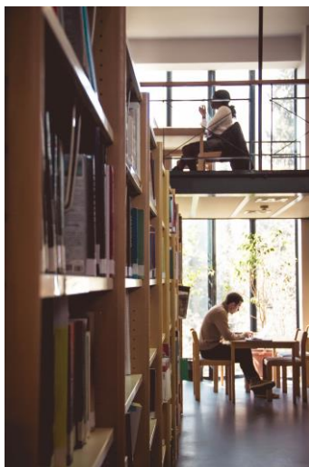
Η βιβλιοθήκη του Χαροκοπείου

Η εκπόνηση πτυχιακής εργασίας δεν είναι υποχρεωτική. Οι φοιτητές που το επιθυμούν μπορούν να την αντικαταστήσουν με τέσσερα (4) επιπλέον μαθήματα επιλογής.