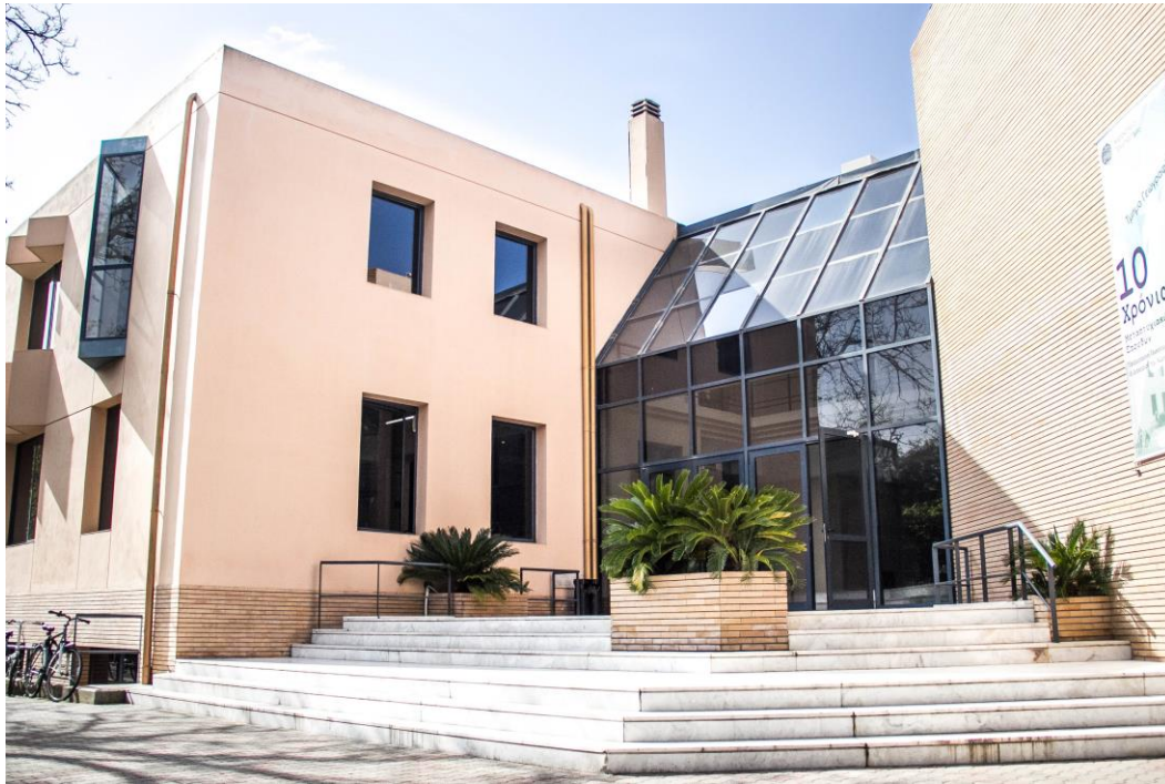
Το κτίριο του Τμήματος Γεωγραφίας

Στόχος του Τμήματος είναι να επιτύχει μέσα από τη συνεχή, συνεπή και ποιοτική λειτουργία του, αφενός την εμπέδωση του αντικειμένου της Γεωγραφίας ως επιστημονικό πεδίο κομβικής σημασίας στην ευρύτερη Ακαδημαϊκή κοινότητα και την ελληνική κοινωνία, και αφετέρου την ανάδειξη του Τμήματος Γεωγραφίας του Χαροκοπείου Πανεπιστημίου ως πρότυπο γεωγραφικής εκπαίδευσης και έρευνας ανταποκρινόμενο στις ανάγκες της σύγχρονης κοινωνίας.