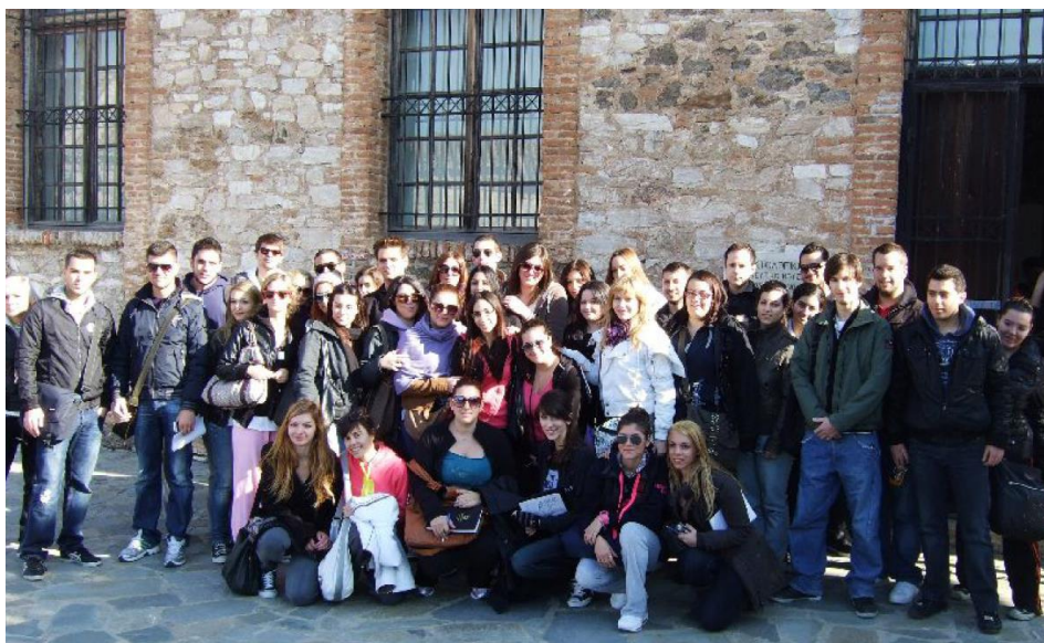
2011: Εκδρομή στη Λαυρεωτική (3 ο έτος)

Εκδρομές και επισκέψεις πραγματοποιούνται στα περισσότερα από τα εξάμηνα, είναι υποχρεωτικές και διαφοροποιούνται σε διάρκεια και περιεχόμενο ανάλογα με τις ανάγκες των μαθημάτων.